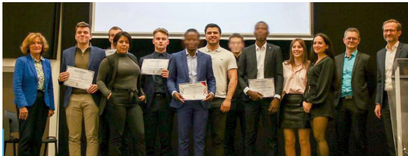
Le parlement des étudiants de Valence compte une soixantaine d'adhérents dont une dizaine d'actifs.

Page Instagram : pevalence. Contact : valence@parlementdesetudiants.fr