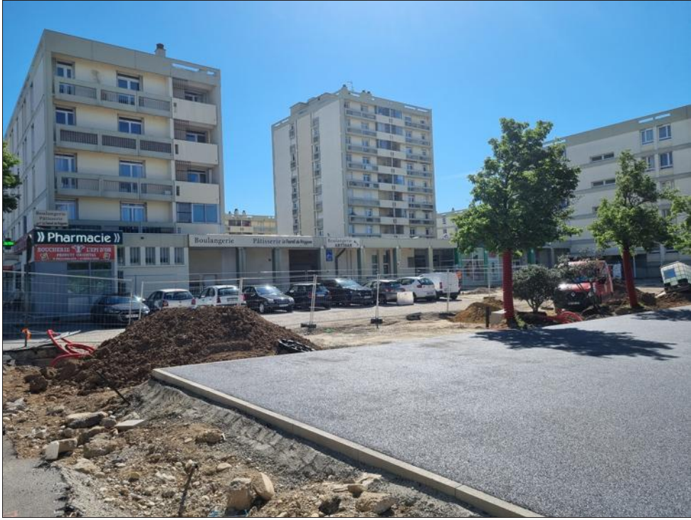
La première phase des travaux place Dunkerque a bien avancé. Elle devrait se terminer en juin.

Ce n'est pas encore le cas, dans les faits, mais les chiffres d'affaires diminuent dangereusement sous les arches du Polygone :