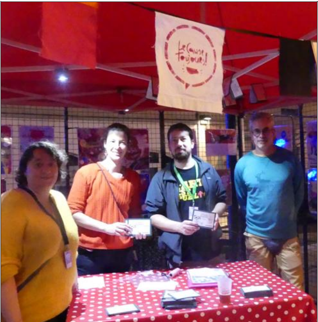
Mis à mal par la crise sanitaire, les bals du Cause toujours ont repris en 2022 et retrouvent leur rythme trimestriel en 2023.