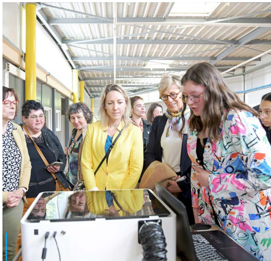
Le Département de la Drôme a investi 90 000 € pour financer un équipement numérique de pointe qui servira pour l'option numérique.

Pour mener à bien leur apprentissage, le Département de la Drôme a investi 90 000 € pour mettre à disposition du collège plusieurs machines numériques telle que deux imprimantes 3D, une découpeuse laser, une fraiseuse numérique, une imprimante textile ou encore 20 ordinateurs avec des logiciels